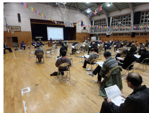
住民説明会の様子