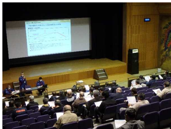
住民説明会の様子