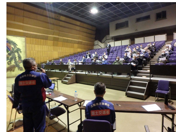
住民説明会の様子 (千曲川河川事務所 職員による説明)

○本格化する信濃川水系緊急治水対策プロジェクトについて、堤防強化や河道掘削などの事業内容及び進め方を説明。