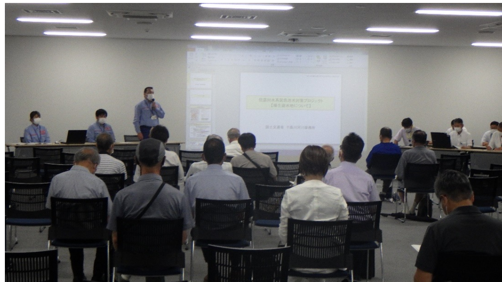
住民説明会の様子