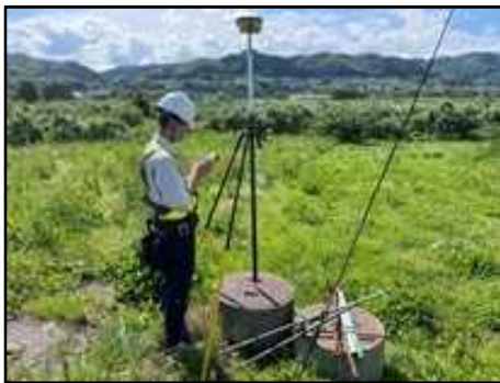
パイプライン調査状況