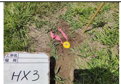
鋏の場合の設置例