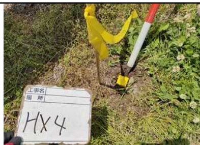
杭の場合の設置例