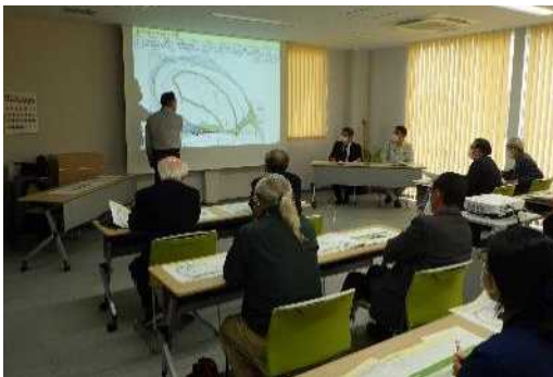
実験概要など説明状況

■今後、実験結果を地域の皆様にご覧頂けるように、映像の準備を進めてまいりますので、公開の際には上今井遊水地だよりにて周知させていただきます。