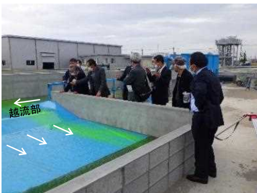
越流部抽出模型実験視察状況