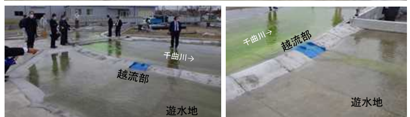
全体模型実験視察状況