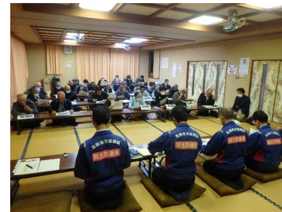
戸隠区住民説明会の様子