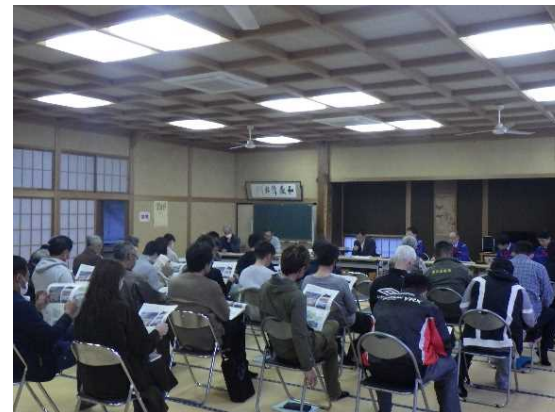
小沼区住民説明会の様子