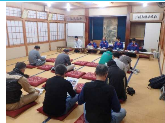
柳新田区住民説明会の様子