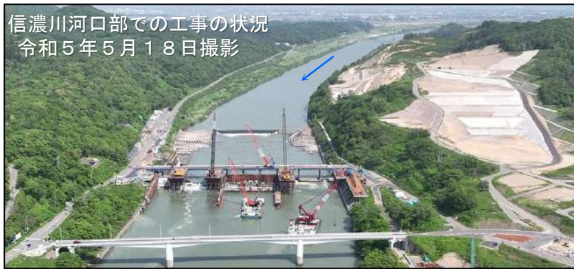
信濃川河口部での工事の状況 令和5年5月18日撮影

令和5年10月24日（火）に、中野市市議会議員有志、対策委員会委員の皆さまにて、遊水地の先進事例として三条市内の五十嵐川遊水地と、信濃川河口部で川幅を広げている大河津分水路河川改修事業の視察が行われ、千曲川河川事務所の職員が同行し、説明を行いました。河口部でも千曲川・信濃川の治水対策を大規模に進めています。