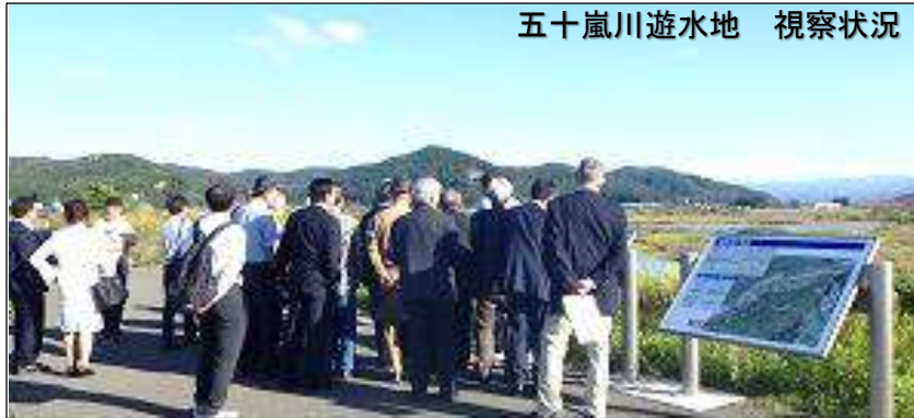
五十嵐川遊水地 視察状況