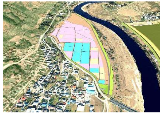
左岸埋立てイメージ図

次回は、3月10日（日）10時～上今井公民館にて、同様の内容で説明会を開催させていただく予定です。