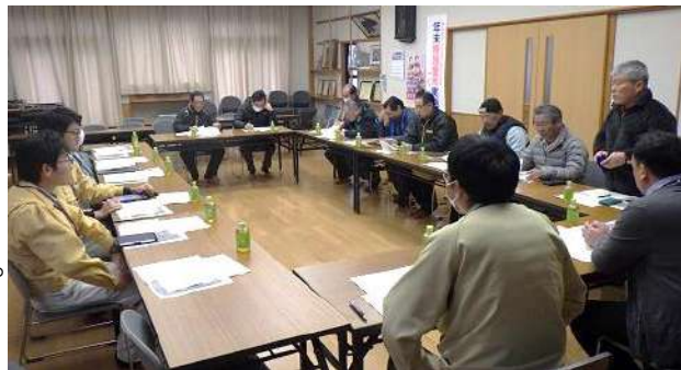
大俣区役員説明の様子

なお、市道大俣線の仮回しについては、本紙表面の記載内容でご確認くださいませよう、よろしくお願いたします。