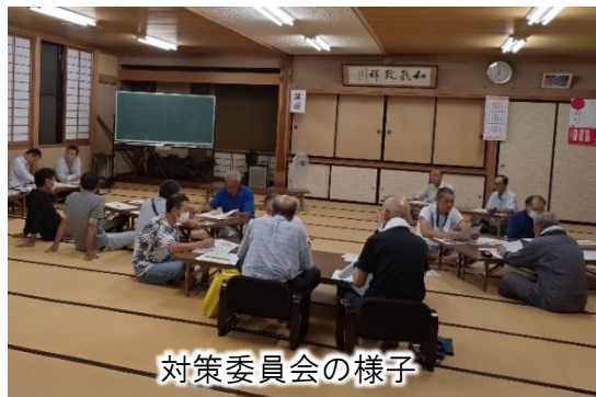
対策委員会の様子

説明内容について対策委員会にて協議いただき、「土地調書・物件調書確認会」、「遊水地整備後の耕作意向アンケート」ともに実施させていただくこととなりました。