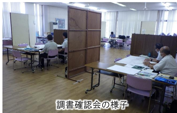
調書確認会の様子

なお、県外にお住まいの方や都合のつかなかった方などへは、今後個別に対応させていただく予定ですので、改めてご連絡させていただきます。