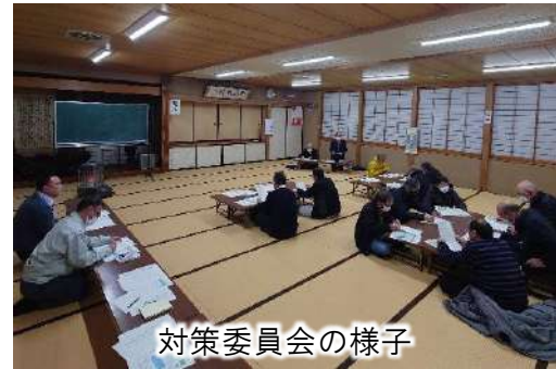
対策委員会の様子

なお、遊水地整備以降も引き続き耕作を継続するための「新組織体制づくり」、「耕作ルールづくり」「農業施設整備の計画案」の詳細につきましては、今月各戸配布にて耕作を継続される方を対象にご案内しております。 「蓮遊水地予定地内における耕作説明会」(3月6日(木) 18時から 会場：秋津地区活性化センター) でご説明させていただきます。