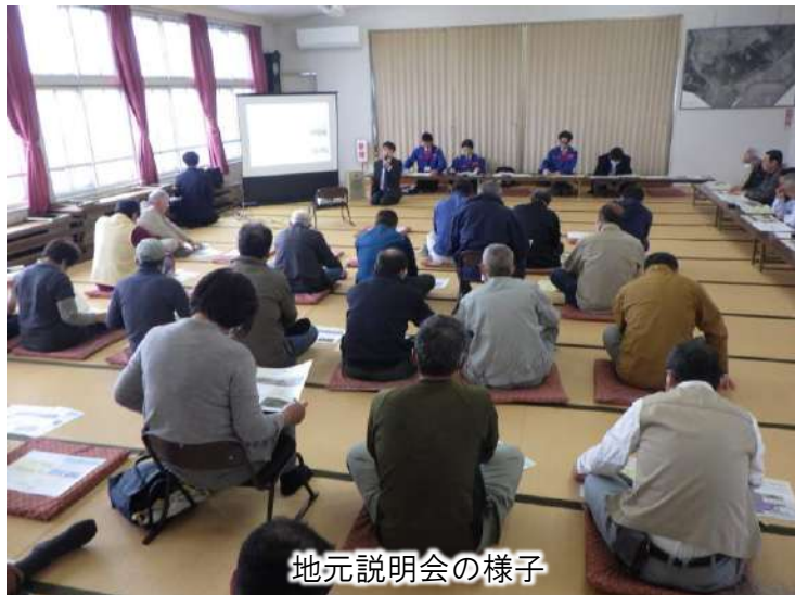
地元説明会の様子