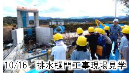
10/16 排水樋門工事現場見学

出前授業では児童向けパンフレット『なるほど!!上今井遊水地』を活用しながら、「遊水地に貯めることができる水の量は東京ドーム何個分?」など、遊水地の役割や整備内容等について学習しました。また現場見学では、工事中の排水樋門を間近で見て、その大きさに驚いている様子でした。