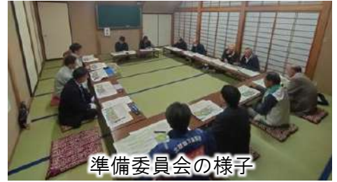
準備委員会の様子